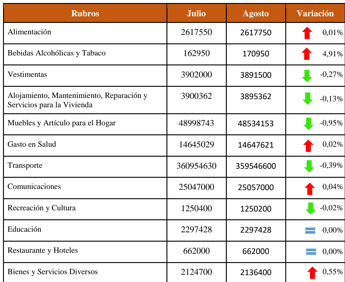
Tabla 1. Variación mensual de precios por rubro